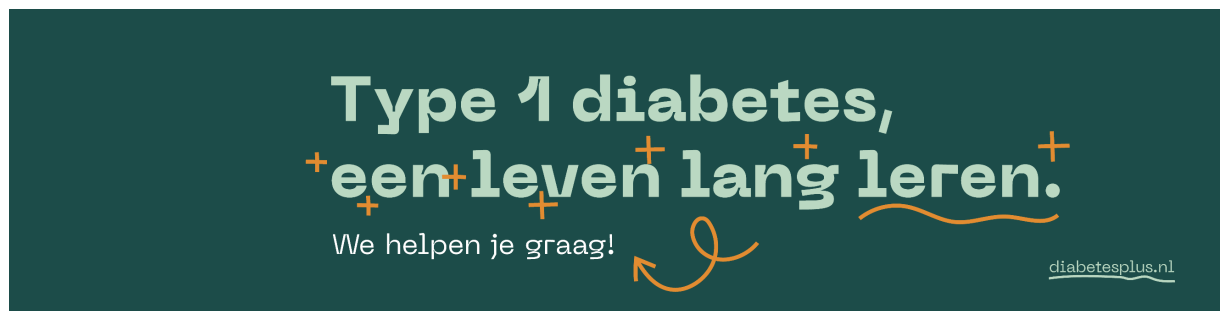
Cas de Heus Directeur-bestuurder Stichting Diabetes+

Hartelijke groet namens iedereen die zich inzet voor Diabetes+ en mijzelf,