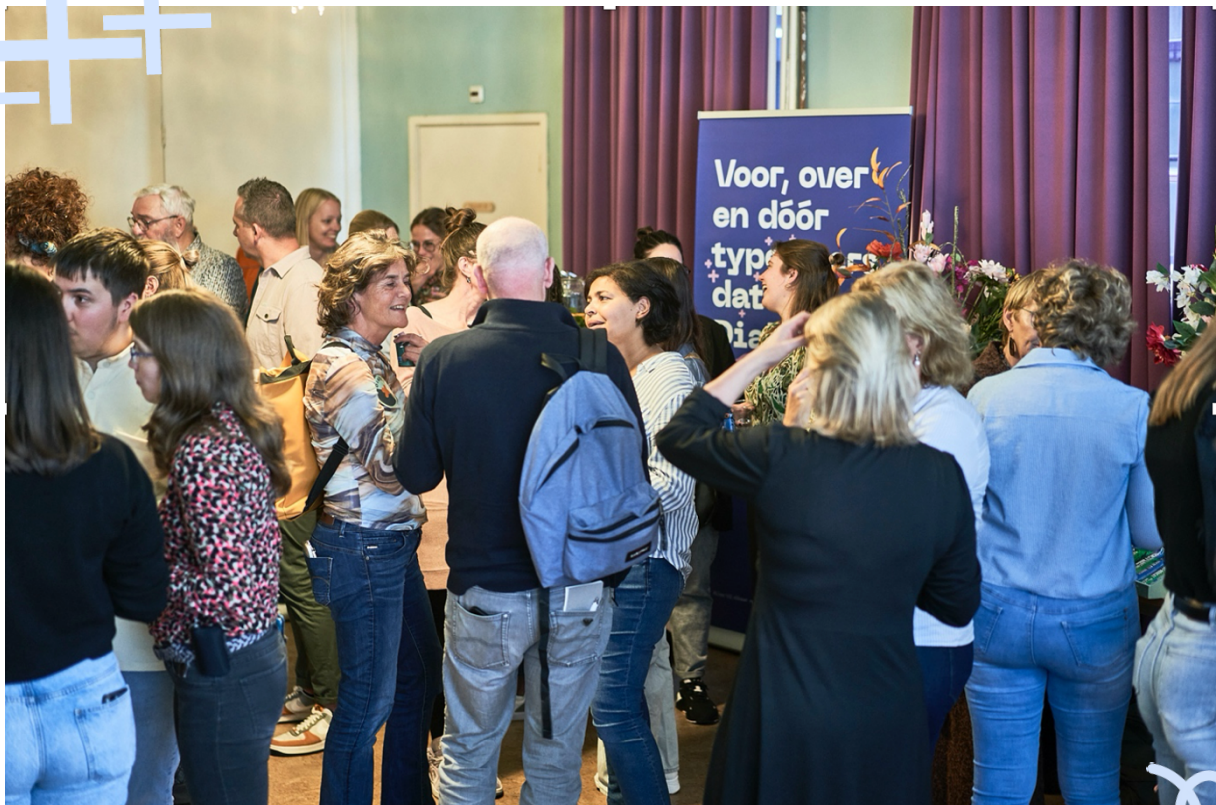
Buddy's in gesprek...

Ook organisatorisch zette het buddyprogramma een grote stap vooruit. In 2025 is een CRM-pakket gebouwd om beter te kunnen registreren, matchen, opvolgen, meten, automatiseren en opschalen. Daarmee is een belangrijke basis gelegd om de groei verantwoord en professioneel te ondersteunen.