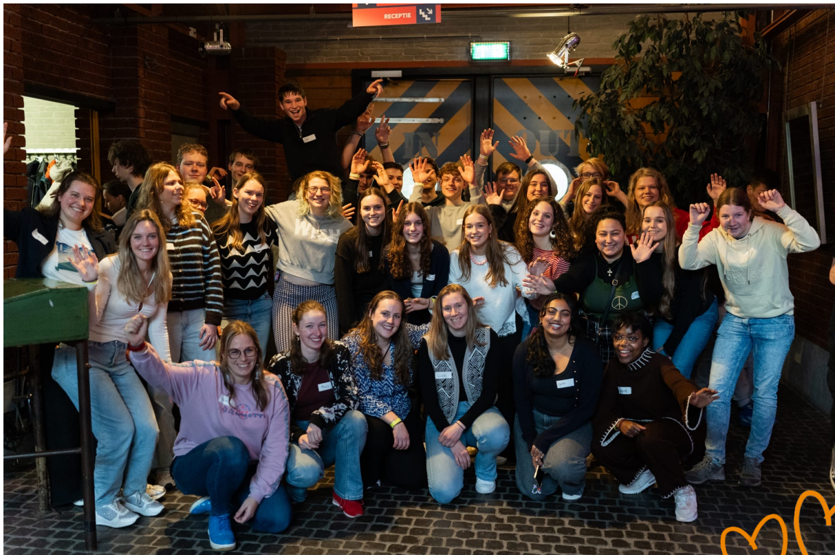
Foto van het eerste succesvolle event voor jongeren: LevelUp T1D.

Onze bijeenkomsten zijn bewust laagdrempelig en mensgericht. Soms informatief, soms verdiepend, soms vooral gericht op ontmoeting en (h)erkenning. Juist de combinatie van inhoud en verbinding maakt de bijeenkomsten waardevol.