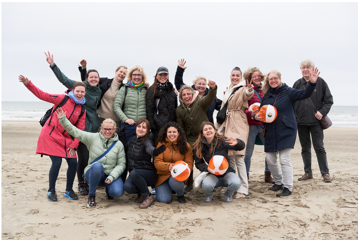
Regiobijeenkomst Noord-Holland, waar een strandwandeling was georganiseerd.

Voor iedereen. Verder organiseren we regelmatig ook nog een centraal evenement en klassikale thema-avonden in samenwerking met ziekenhuizen. Bekijk een aftermovie hier .